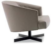
7 MARTIN SESSEL DREHBAR CM 78X86 H70